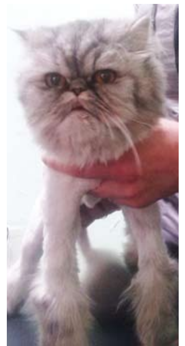
Šiam katinui, virtusiam dailiu liūtuku, narkozės taikyti nereikėjo...