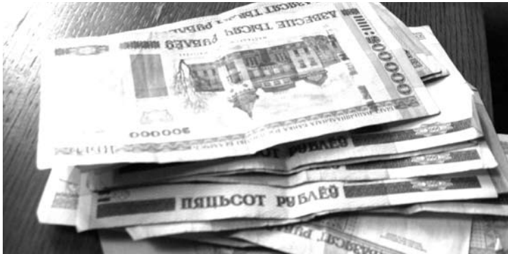
Čia daugiau nei milijonas...

Iš trumpos mano kelionės po Baltarusiją vienas stipriausių išpūdžių liko pinigai. Gardine išsikeitęs šimtą eurų, gavau pusantro milijono baltarusiškų rublių ir, kol juos išleidau, džiuginau kasininkes. Pirkdamas laikraštį paduoti pardavėjai pluoštą pinigų - jį ką nori tą išsirenka, mat, jei pats skaičiuosi, tai laikraštis pasens.