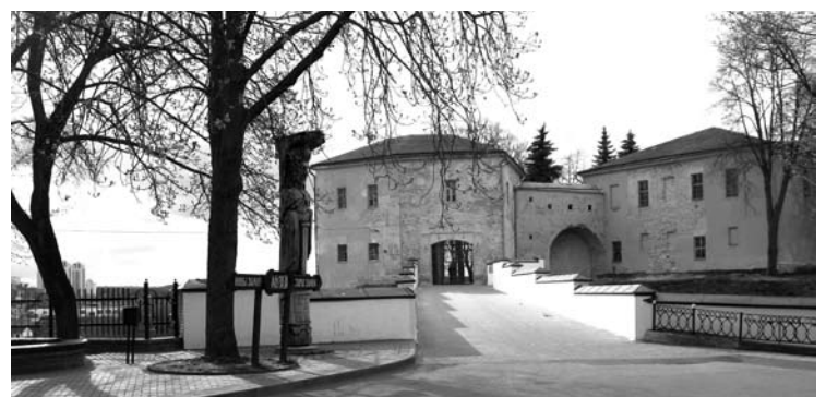
Gardino pilies vaizdas daug kartų keitėsi. Ji griauta, plėšta, deginta. Paskutinį kartą ji atstatyta XIX amžiuje.