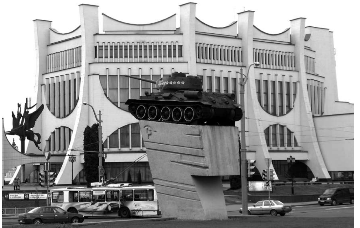
Teatras ir tankas.

rublius. Su baltarusiais gera kalbėti. Normalūs žmonės, rusiškai supranta, bet man nuo to nebuvo geriau. Keityklą radau su lenkų turistų pagalba. Vietiniams, matyt, pinigų kaitaliojimas nėra aktualus. Paskui supratau, kad apskritai valiutos keityklų Baltarusijoje nėra daug - net kioskuose ir mažose parduotuvėse galima atsiskaityti banko kortelėmis. Baltarusija šioje sferoje gal net toliau pažengusi nei Lietuva. Grynųjų ten reikia tik einant į mokamą tualetą, aukojant bažnyčiai, na gal dar ir ne visi muziejai bei prekiautojai suvenyrais turi kortelių nuskaitymo įrenginius. Tiesa, ir vietinio susisiekimo maršrutiniuose autobusuose bei taksi, kortelių skaitytuvų nemačiau, bet taksistai mielai ima eurus ir dolerius ir juos vertina vienas prie vieno. O maršrutinių autobusų vairuotojai pinigų deda į batų dėžes ir po reiso, matyt, buhalterui atneša kelis kilogramus pinigų.