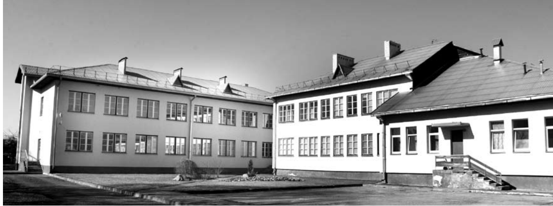
Buvęs Raguvėlė pagrindinės mokyklos pastatas, nors ant klasių dar tebekaba pavadinimai, įgauna naujas gyvenimo formas.

Jauniausios Anykščių rajone Raguvėlės mokyklos pastato neištiko kitų uždarytų pagrindinių mokyklų likimas. Pastatas nežioji išdažytas langais ir išluptomis plytomis. Čia dabar veikia trys skirtingos įstaigos, žada įsikelti dar viena. Dviaukščių mokyklos pastatu naudojasi 20 mažiausių raguvėliečių. O į mokyklą čia galėjusius eiti raguvėliečių vaikus skirtingomis kryptimis išsivežioja mokykliniai autobusiukai.