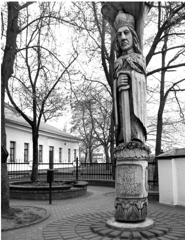
Gardino pilį tebesaugo Vytautas Didysis.